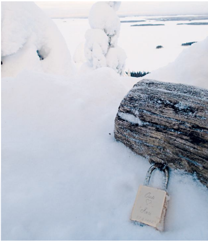
Kolin kansallismaisemaan on naulattu lemменlukko paksuun pölliin.